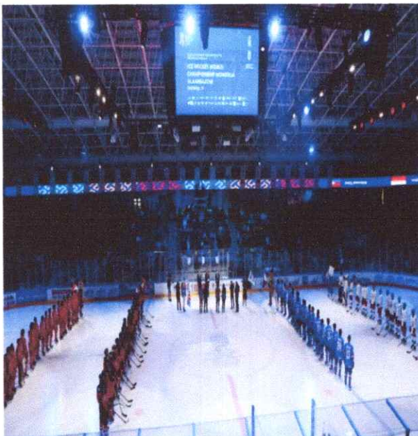
Зураг-6 Улаанбаатар хотын аварга шалгаруулах Хоккейн тэмцээн